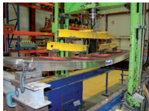
Essai de flexion