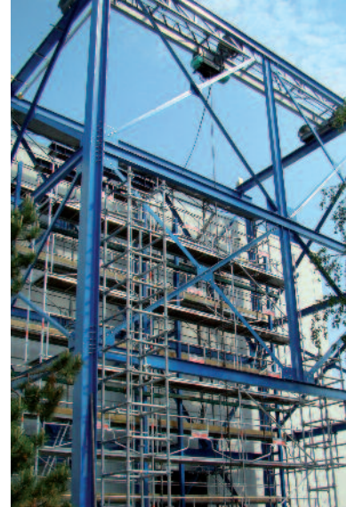
Station d'essais de grandes structures

Prélever Analyser Diagnostiquer Recommander