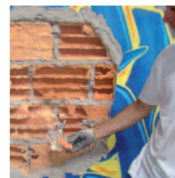
Essai d'arrachement in situ