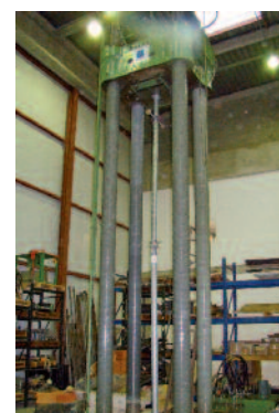
Presse de 10000 kN

Le LEEMS (Laboratoire d'études et d'Essais des Matériels et Structures) est spécialisé dans les techniques d'investigations destructives pour aller au bout de la compréhension du matériau et la structure.