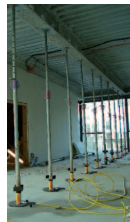
Essai in situ