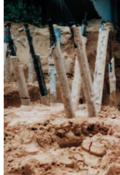
Station d'essai de GINGER CEBTP Micropieux du projet FOREVER

Prélever Analyser Diagnostiquer Recommander