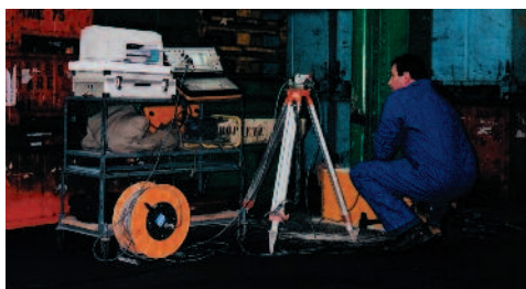
Recherche d'ancrage de fondation d'un poteau d'une usine.