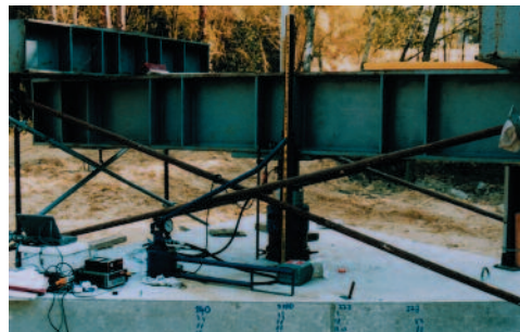
Semelle chargée sur sol renforcé