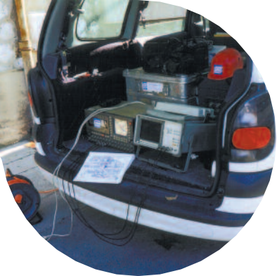
Mesures de vibrations sur chantier